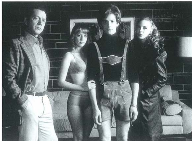
Bernard Giraudeau, Ludivine Sagnier, Malik Zidi, Anna Thomson